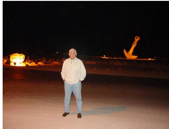
עפ"י רישיון הדייג – לכיסוי פעילותי בפלי"ם – הנני תושב קיסריה מיוני 1947