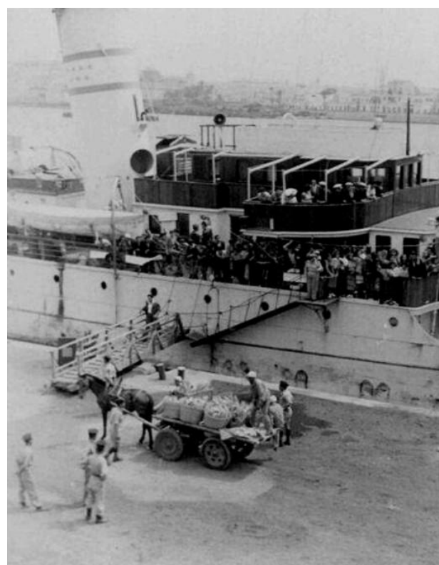
האוניה 'אילת' בנמל בנגזי