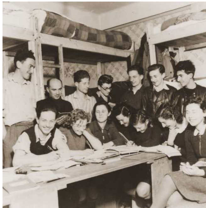
חבורת נוער בשאבץ

כל אותו קיץ 1940 נישארו הפליטים בקלאדובו "תקועים" באותו המקום, אם כי לא סבלו עוד כפי שסבלו בחורף. האנשים עסקו בספורט, שיחקו, קיימו ערבי הווי ועוד. זוגות חדשים ואהבות פרחו, ו-15 חתונות נערכו. תרצה מתארת: "הדנובה זרמה והכל היה ירוק", שם הכירה והתאהבה בבעלה לעתיד, אלוף דן לנר. בחודש ספטמבר קיבל שפיצר רשות מהשלטונות להעביר את כל הקבוצה לשאבץ, עיירה קטנה בקרבת בלגרד הבירה. חלק מהאנשים גרו בבתים פרטיים, קבוצת אנשי "החלוץ" התמקמה בטחנת קמח שרופה, הבנים בקומה אחת והבנות בקומה מעל, המטבח היה משותף. בשאבץ הייתה קהילה יהודית קטנה, כ-70 איש, ובניין בית הכנסת הפך לבית ספר לילדים הקטנים, כ-20 במספר.