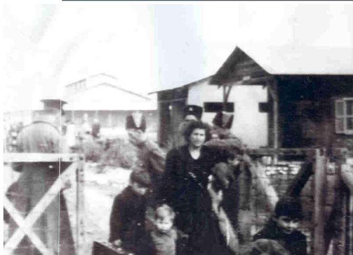
<<<<<< עולי "ניאסה" בעתלית