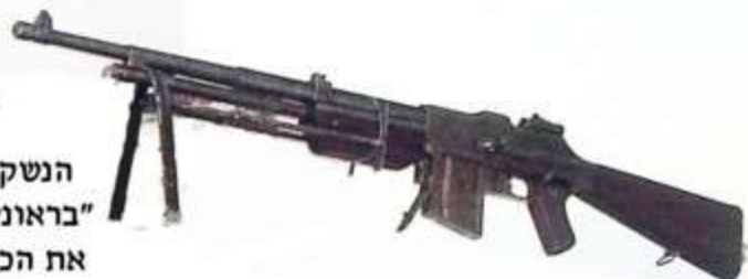
הנשק שהוברח במכבשים. מימין: מקלע "בראונינג" מתוצרת פולין, שקיבל ב"הגנה" את הכינוי "רקס". משמאל: גרסה פולנית של הרובה הגרמני "מאוור 98".