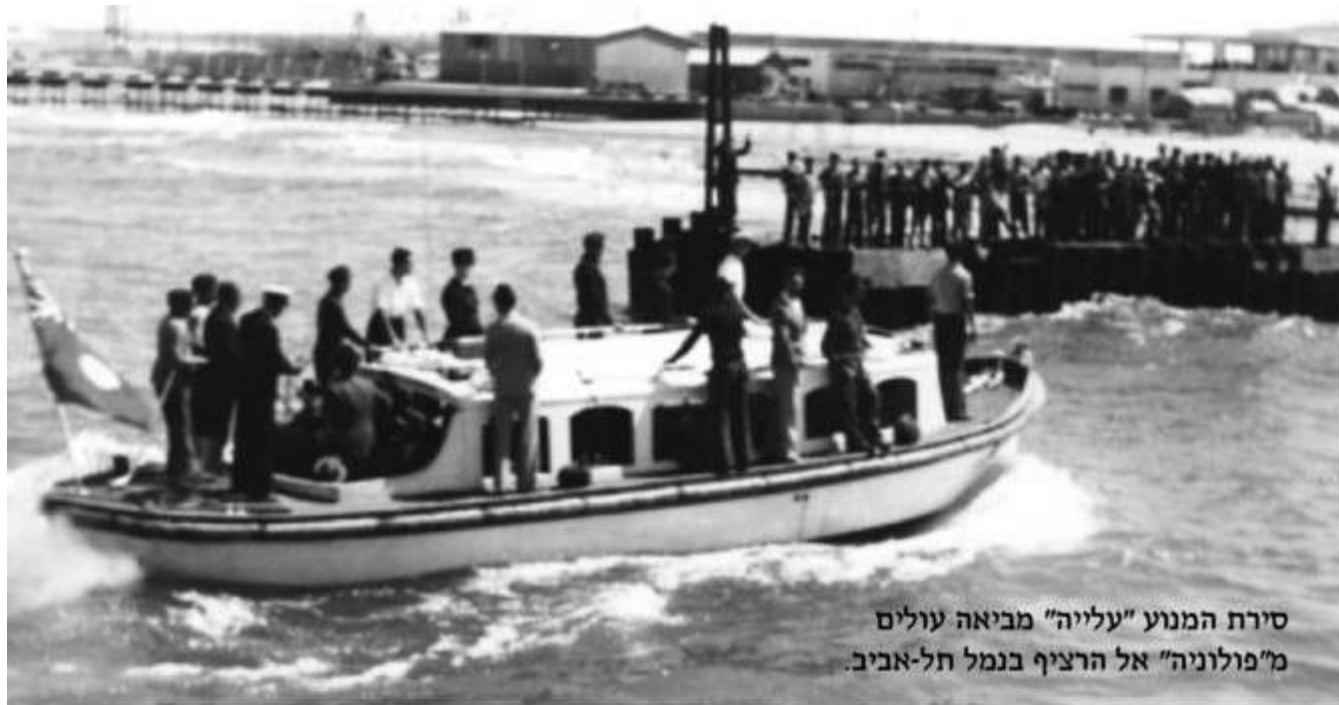
סירת המנוע "עלייה" מביאה עולים מ"פולוניה" אל הרציף בנמל תל-אביב.

עגנית הבכורה של ה"פולוניה" מול נמל תל-אביב הייתה ב-11 באפריל 1938, כחודש וחצי לאחר פתיחתו לתנועת נוסעים. הייתה זו סיבה טובה למסיבה, כפי שמעידה הכותרת להלן, שהופיעה למחרת ב"דבר":