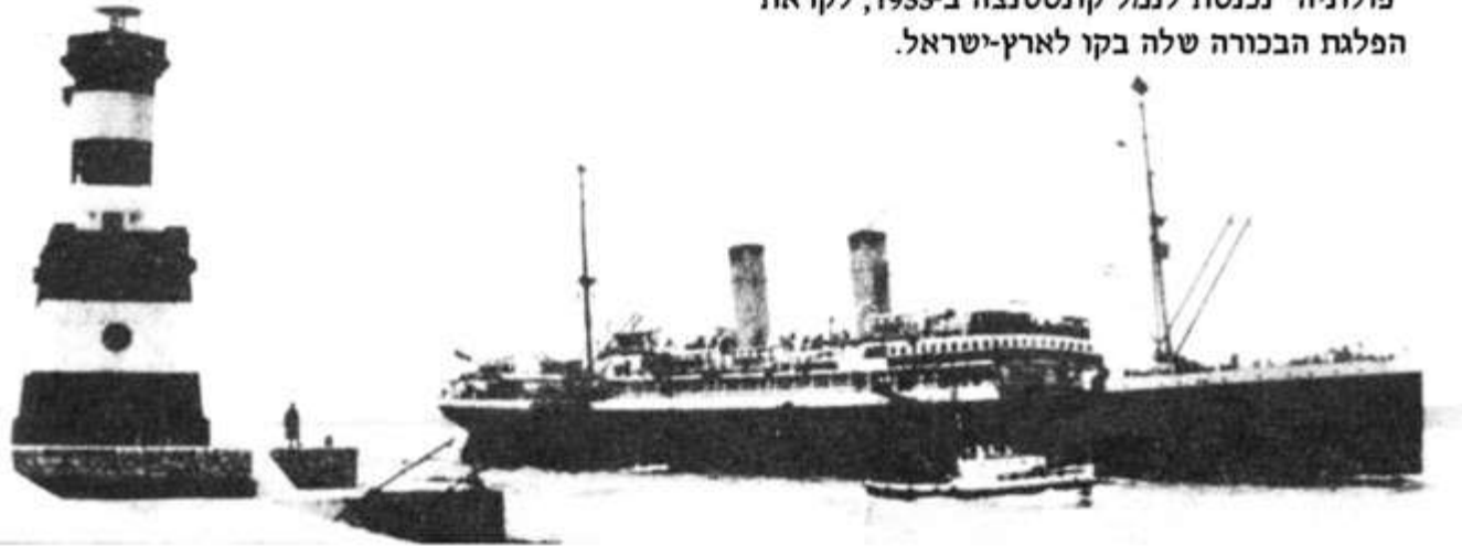
"פולוניה" נכנסת לנמל קונסטנצה ב-1933, לקראת הפלגת הבכורה שלה בקו לארץ-ישראל.

מה שמשך את הנהלת חברת "גדיניה-אמריקה" בתחילת שנות ה-30, להפעיל את "פולוניה" בקו לארץ-ישראל היה גל העלייה הגדול של יהודים שהאנטישמיות, האפליה, המיסים הכבדים והעוני בפולין דאז המאיסו עליהם את החיים שם והם החליטו לעזוב הכל מאחוריהם לטובת חיים חדשים בארץ. מספר העולים מפולין בעשור ההוא נאמד בכ-200 אלף ובדיעבד הצילה אותם עלייתם מהשואה. במקביל, היתה זרימה מתמדת של נוסעים גם בכיוון ההפוך, אם של עולים שלא מצאו כאן פרנסה ואם של עולים שהתבססו ונסעו לביקור אצל קרוביהם בפולין. הנהלת החברה ראתה בתנועה הערה הזאת מקור הכנסה פוטנציאלי נכבד והחליטה לנצל. השיקול הזה הצדיק את עצמו, במיוחד לאחר שהסוכנות היהודית חתמה עם חברת "גדיניה-אמריקה" על הסכם, שלפיו יופנו כל העולים מפולין, להפלגה ארצה ב"פולוניה". בעיקבות זאת נסעו העולים שקיבלו סרטיפיקטים (רשיונות עלייה) של ממשלת המנדט, מפולין לרומניה שלושה ימים ברכבת, עלו לסיפון "פולוניה" בנמל קונסטנצה וכעבור ארבעה ימים נחתו בארץ.