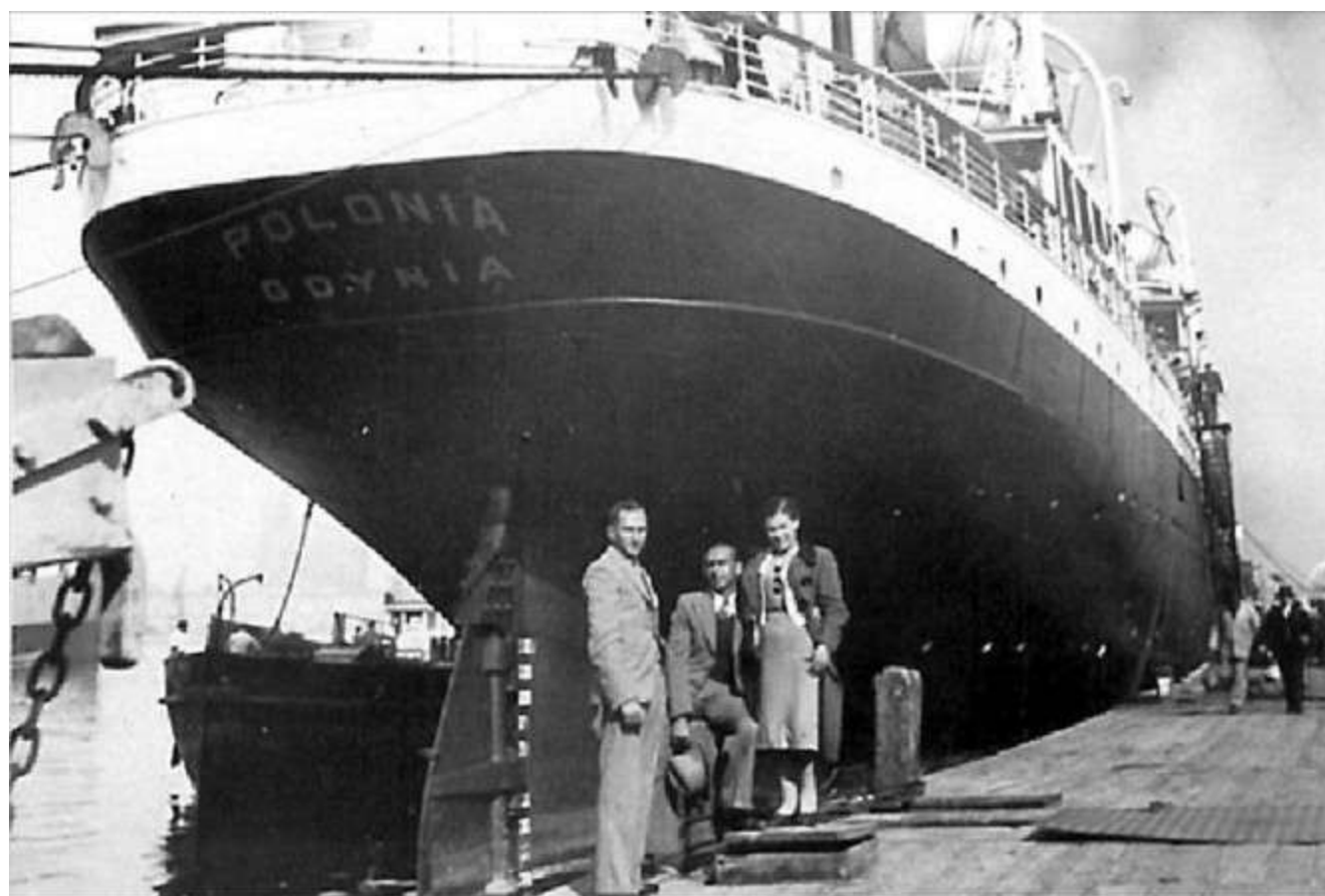
"המחותנים" האמיתיים: עולים שזה אך הגיעו מפולין לקונסטנצה ברכבת, מצטלמים למזכרת ליד ירכתי ה"פולוניה", לפני העלייה לסיפון האונייה.