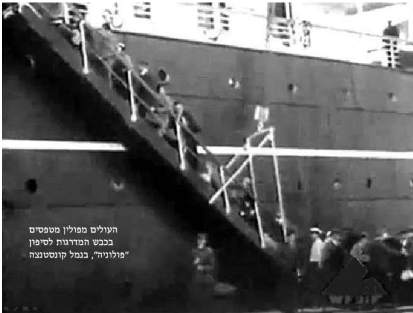
העולים מפולין מטפסים בכבש המדרגות לסיפון "פולוניה", בנמל קונסטנצה