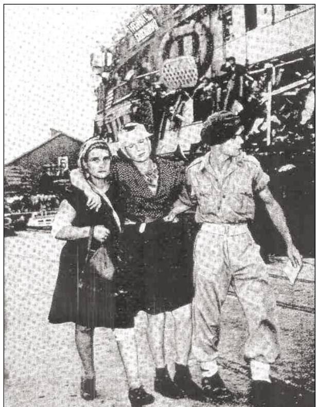
מתוך הספר "הספינה שניצחה" מאת ברכה חבס, שיצא לאור בשנת 1948