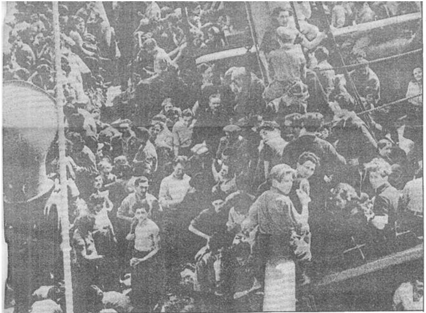
מראה רגיל על סיפונה של „תיאודור הרצל“, תחת השמיים הבהירים וקרני השמש החמימות של אפריל בים התיכון

שידרנו לארץ שאלה באלהוט, שאמרה: „מהרצל — האם יכולים ארבעה מלווים לה" תחבא באניה?" התשובה שקיבלנו היתה: „מארגן — הכינו מקום-סתר בספינה והסתירו מספר אנשים, עד שיעלו אנשינו לנקות את הספינה. על האנ- שים להצטייד באוכל ובמים ליומיים ובמסטי- כות גאו. הודיעו לנו את מקום המנובוא."