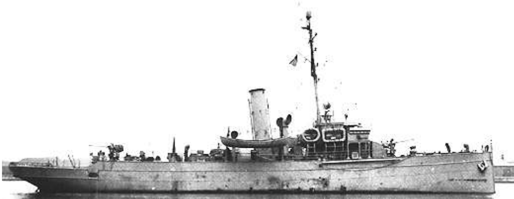
ה'אולואה' במקורה כספינת משמר חופים בשם USS WPG-53 Unalga