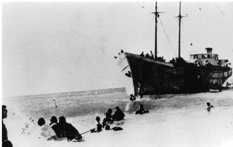
'האומות המאוחדות' בחוף נהריה