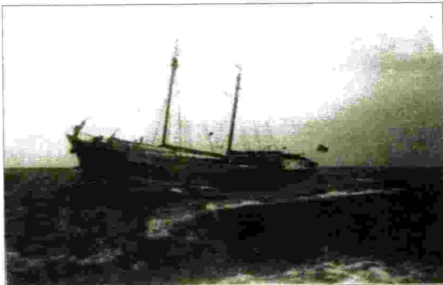
הספינה "נרקיס" - עסקה בהחזרת גולי קפריסין לארץ - נובמבר 1948

כשהגעתי לקיסריה נתנו לי להרריך בקורס 3 או 4 אנשים מבוגרים. פחדתי להרריך מבוגרים שלא ירצו לשמוע בקולי. אחרי מספר ימים ראיתי שהכל מסתדר ומאז נשארתי עד גיוסי לחיל הים. בפלוגה הועסקתי בכל מיני תפקידים כנהג ובהורדות מכל ספינות המעפילים שהגיעו לארץ (לחופי ישראל) ב"שכתאי לוז'ינסקי" נתפסנו בחוף ניצנים, הבריטים תפסו כמעט את כל גדוד 4 והעבירו אותנו