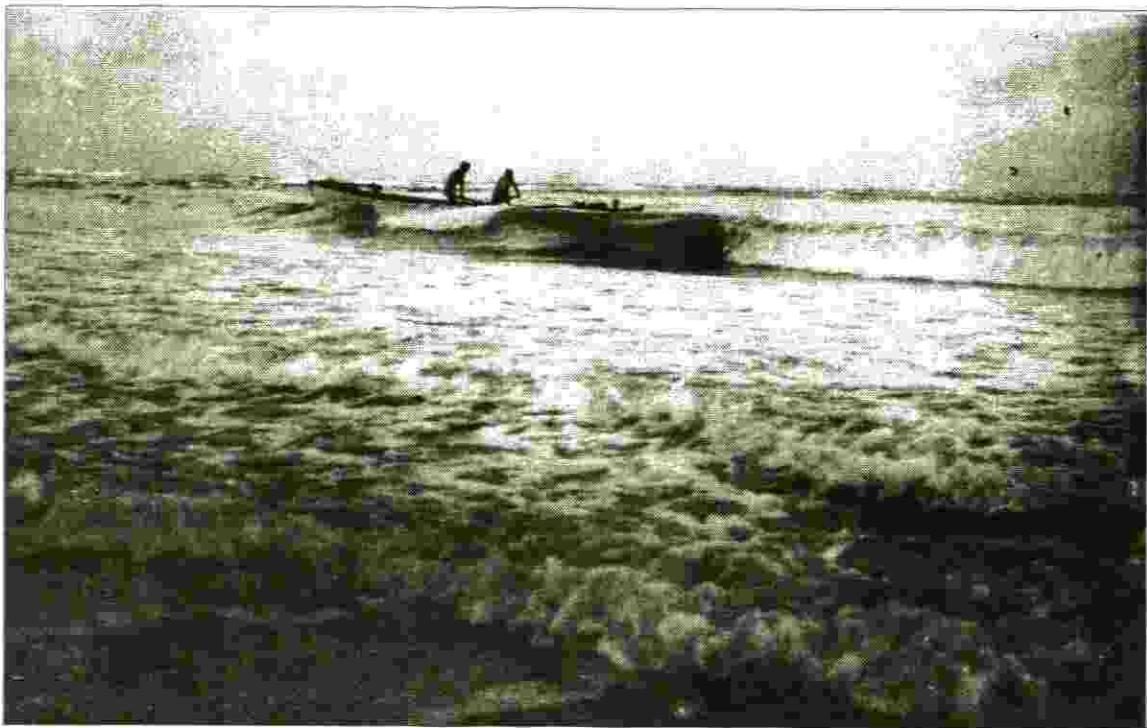
בגלים סוערים - להוציא את הסירות מהמים

להרחבת הידע המקצועי נשלחתי לארה"ב לקורס תכנון נחיתה בסן דיאגו קליפורניה Amphibious Warfare Plannin לאחר חזרה מארה"ב, הקמנו צוות וכתבנו את תורת הנחיתה בחיל הים. מיולי 1967 ועד 1970 מונתי כמפקד בסיס אשדוד בנוסף להיותי מפקד שייטת 11 (בתקופה זו גם הקמנו ובנינו את הבסיס). השתחררתי ב-1970.