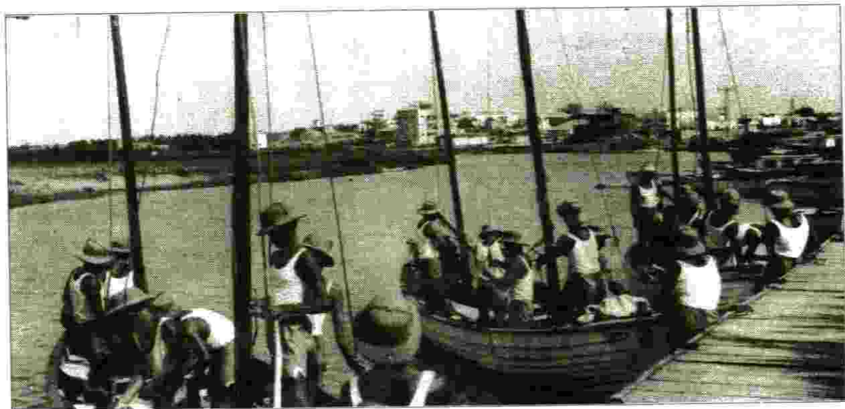
אימוני פלוגות הים של "ההגנה" בסירות "הפועל" בירקון ("נחשוך", "ברגר", "וייצמן")