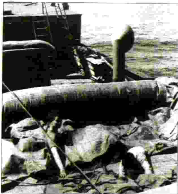
לאחר העברת המעפילים לאוניה "יחיעם"

בגמר ההעמסה, המפקד נתן לי את מפתחות מחסן המזון והכי חשוב של המים, הכי קשה היה קיצוב המים. רוב האנשים התייחסו לחוסר המים בהכנה, אך היו גם אחרים שהתלוננו. בסה"כ התנהגות האנשים היתה טובה. בניתוק החבל מהחוף, החבל נתפס במדחף ולא יכולנו להפליג. היה מחניק בבטן האוניה, על כך ודאי יספר יוסקה עצמו. כנ"ל לגבי הקלקול ברודים להעברת המעפילים לספינה אחרת (דומני "יחי עם").