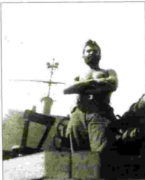
על אח"י הגנה" - ק-20

עכרנו גם את צה"ל, ובו נדבר גלויות זה היה כוד היתוך, קיבוץ גלויות, עברו שנים, ושוב ניפגשים, פה ושם והיום כאן כן ירבו המפגשים כמו הפעם בעמיקם.