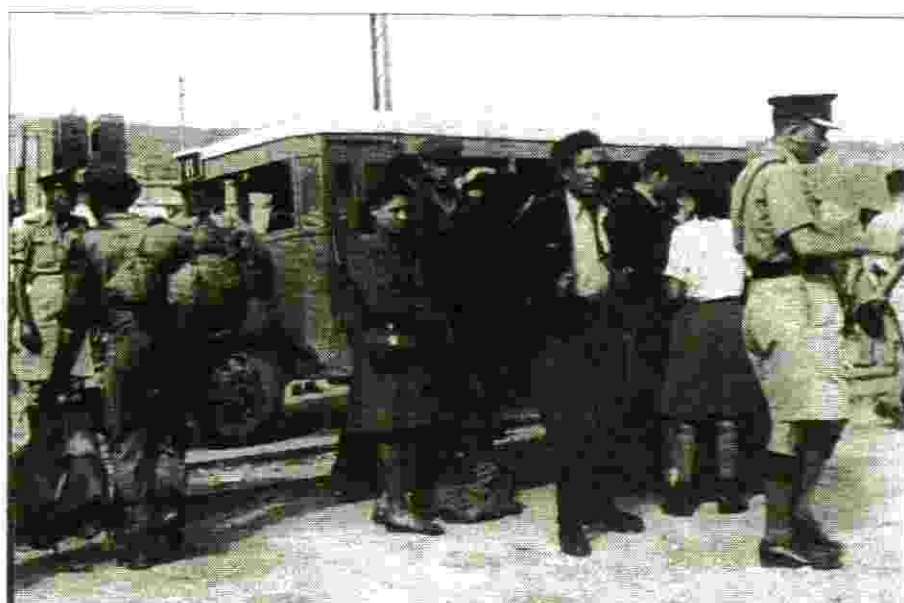
מהאוניה ישר למחנה המעצר ב"עתלית"

בהמשך קיבל צריף בקירבת בארי ומשם פעל בכל הכיוונים. במחנה זה, מחנה "דרור", שממנו ארגנו את העלייה לארץ הכרתי אותו כשהייתי בת שבע עשרה. אני עליתי לארץ בעלייה ב' באוניה "אנצ'ו סירני". אחרי שהות של שבועיים במחנה עתלית הגעתי לקיבוץ תל-יצחק. חיים נשאר עדיין זמן מה באיטליה כדי לסיים את תפקידו. כעבור כמה חודשים הגיע גם בוא ארצה, התחתנו