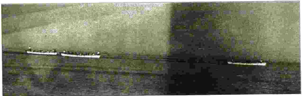
אימוני חתירה בקורסים למפקדי הסירות

עם שובי לארץ ב-1948 הישוב בארץ היה נתון במלחמת העצמאות, והתגייסתי עם חברי חיים גורי ליחידת הצנחנים, שהחלו בהקמתה. ביחידה זו שירתתי עד שחרורי מצה"ל. עם שחרורי מצה"ל, ואני אז בן עשרים וחמש, פניתי ללימודים. מאחר ולא למדתי בבי"ס תיכון, למדתי בעצמי במשך שנה, עמדותי בבחינות אקסטרניות והתקבלתי לאוניברסיטה העברית ללימודי פולוסופיה והיסטוריה. לאחר קבלת תואר B.A. זכיתי במלגת לימודים באוניברסיטת New School for Social Research בניו-