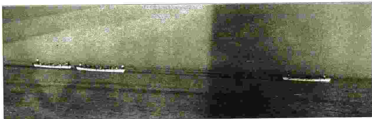
אימוני חתירה בקורסים למפקדי הסירות

עם שובי לארץ ב-1948 הישוב בארץ היה נתון במלחמת העצמאות, והתגייסתי עם חברי חיים גורי ליחידת הצנחנים, שהחלו בהקמתה. ביחידה זו שירתתי עד שחרורי מצה"ל. עם שחרורי מצה"ל, ואני אז בן עשרים וחמש, פניתי ללימודים. מאחר ולא למדתי בבי"ס תיכון, למדתי בעצמי במשך שנה, עמדותי בבחינות אקסטרניות והתקבלתי לאוניברסיטה העברית ללימודי פולוסופיה והיסטוריה. לאחר קבלת תואר B.A. זכיתי במלגת לימודים באוניברסיטת New School for Social Research בניו-