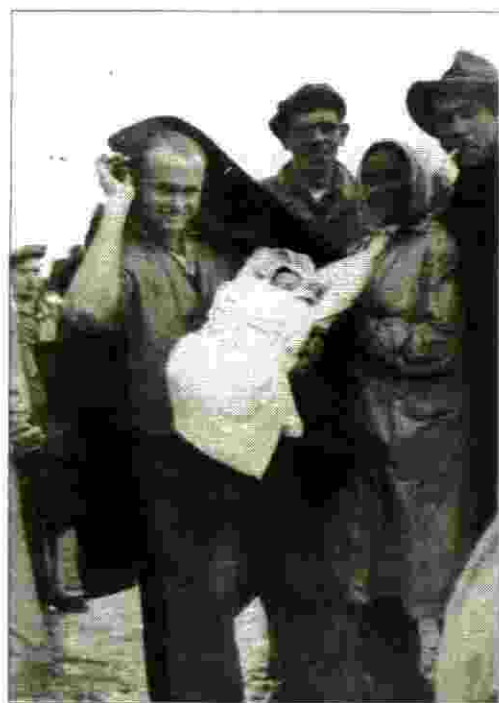
הפלמ"חניק המילד עם התינוקת "גליה" מהאנייה "ירושלים הנצורה"

עם תום מלחמת העצמאות, המשכתי זמן מסוים כימאי. עברתי קורס קצינים ועבדתי תקופות כקצין על אניה. עסקתי בעבודות שונות, בעיקר חיצוב מנהרות, מקצוע שהשתלמתי בו. בשנת 1961 עברתי למושב שרונה. הקמתי משק שעיקרו עדר בקר לבשר. בו אני עוסק עד היום. כמשך השנים נולדו לי בת ושלושה בנים, ומהם יש לי שישה עשר נכדים.