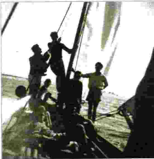
קורס מפקדי סירות מס' 1

עד היום ועם זמן פרח ז'ל אשר היה כחונך לי, נקשרה ידידות עמוקה במיוחד.