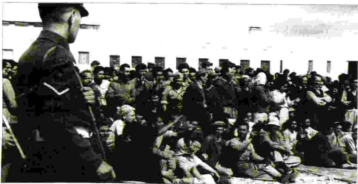
בחוף ניצנים תושבי הסביבה לעזרת מעפילי "שבתאי לוח'נסקו"