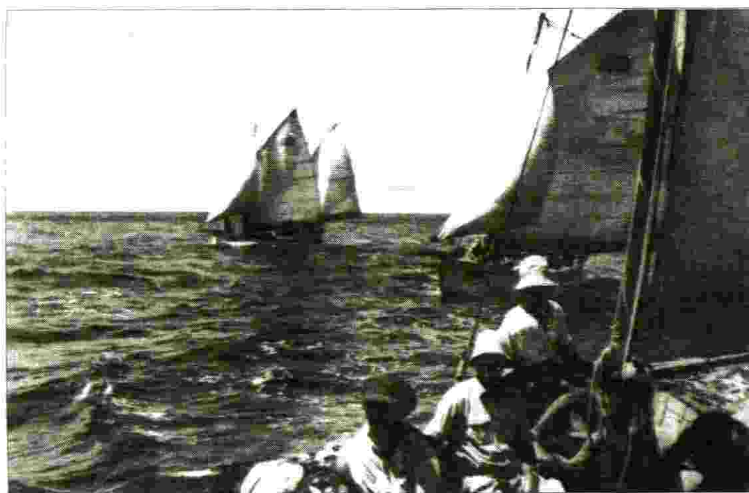
באימונים בקורסים ל"מפקדי הסירות"

בקפריסין בשבוע הראשון עסקתי בחלוקת ציוד ובגדים לאנשים שבאו על ה"קדימה". הבריטים אספו את כל הציוד מהאוניה, העמיסו על משאיות וזרקו בערימה אחת במחנה. אני דאגתי שיכניסו הכל למחסן ודאגתי לחלוקה מסודרת.