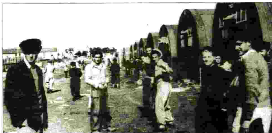
מחנות קפריסין גם עבור הנוער

נסענו באוטובוס לת"א לסמינר הקיבוצים על שפת הירקון (היום אכסנית הנוער) שם חיכינו עד הערב. אז הלכנו לצריף של הפלוגה הימית של הפועל, לקחנו סירות עם משוטים, יצאנו לים וחתרנו דרומה עד רציף הביוב מתחת לבית הקברות המוסלמי (היום מלון הילטון). הורי גרו ליד חוף נמל ת"א ולא ידעו שעברתי כמה עשרות מטרים מביתם.