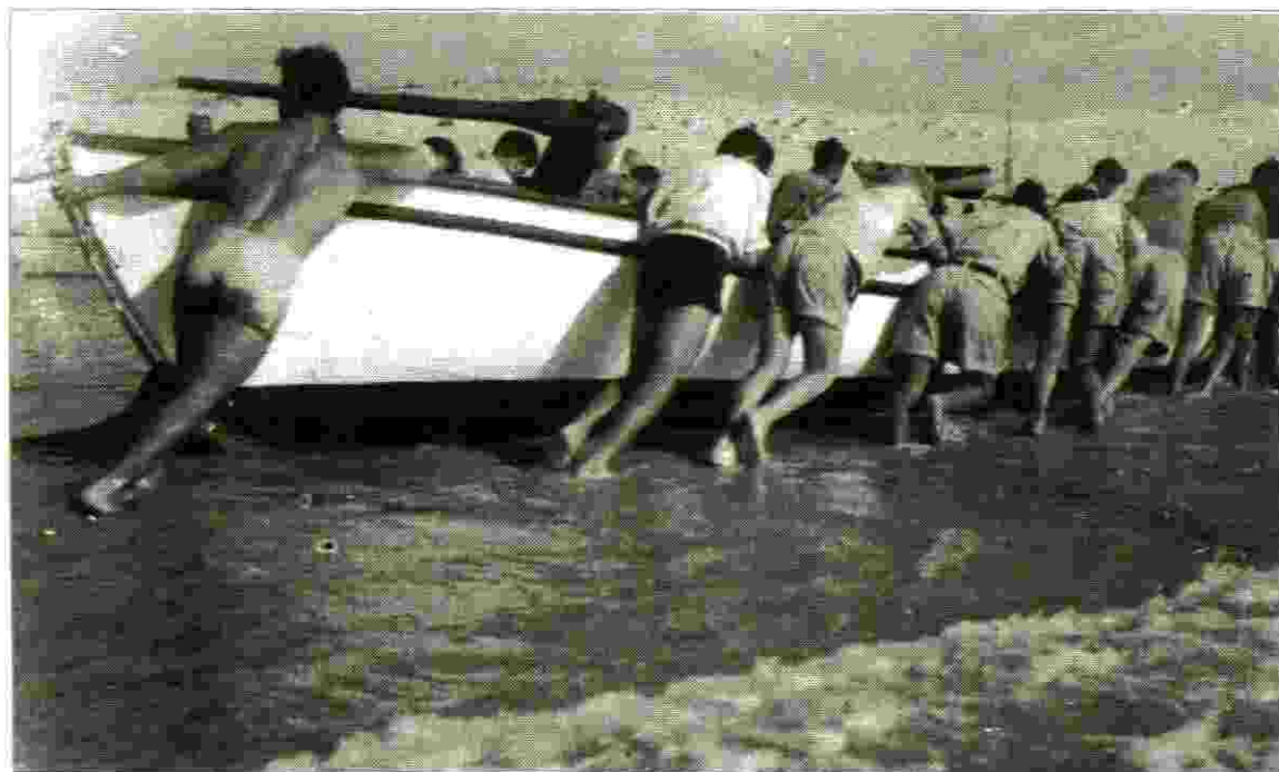
היי-הופ! להוציא את הסירות מהמים

מאזורים בנויים, וכו' היו מפוזרים צריפנו בין סלעים ואדמת ברוך סחופה, עצי זיתים וחרוכים ובעיקר יער טבעי. כמעט במעורב אתנו גרו שכנינו הערבים, אף הם בצריפים אך גם באוהלים. מלאי ומעוררי עניין ומסקרנים היו שכבות הסלעים והופעות המינרלים כקלציט וקוורץ ולידם הרבה מאובנים, שהקפואו עולם תוסס מן העבר של טרם הופעת האדם. במרחב סלעי זה היו מגרשי המשחקים המשותפים שלנו עם הילדים הערבים. חברות זו אפשרה לנו להציץ לעולמם, לראות את אורחות חייהם, להיות מוזמנים לחגיגותיהם. הכל כה שונה משלנו, כה ציורי, צבעוני. בתנאים אלה התפתחה סקרנות למיגון הסלעים והמאובנים ולשוני צבעוני ומרתק של תרבות שונה מאד משלנו, אורחותיהם של שכנינו. חשוב להבהיר, צפינו בחייהם לא כתיירים הבאים לרגע וחולפים עם רשמי הרף עין, שטחיים. צפינו כשותפים, החיים במקביל, על כל עונות השנה, המשפחה, המשחק והשמחה והעצב. צפינו בשילוב, אמנם מוגבל בטבעו, אך כאורחים פעילים (יותר עם הילדים) ולאורך זמן של שנים.