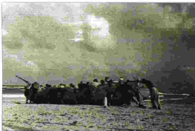
כשוך הסערה מורידים את הסירות לים

לאחר חצות יצאנו לחוף הים, בקרבת נהריה, שכבנו על החול וחיכינו להגעת ספינת המעפילים. הספינה הגיעה לפנות בוקר. נכנסנו לסירות אשר היו מוסתרות בקרבת החוף. חתרנו לספינה, הורדנו את