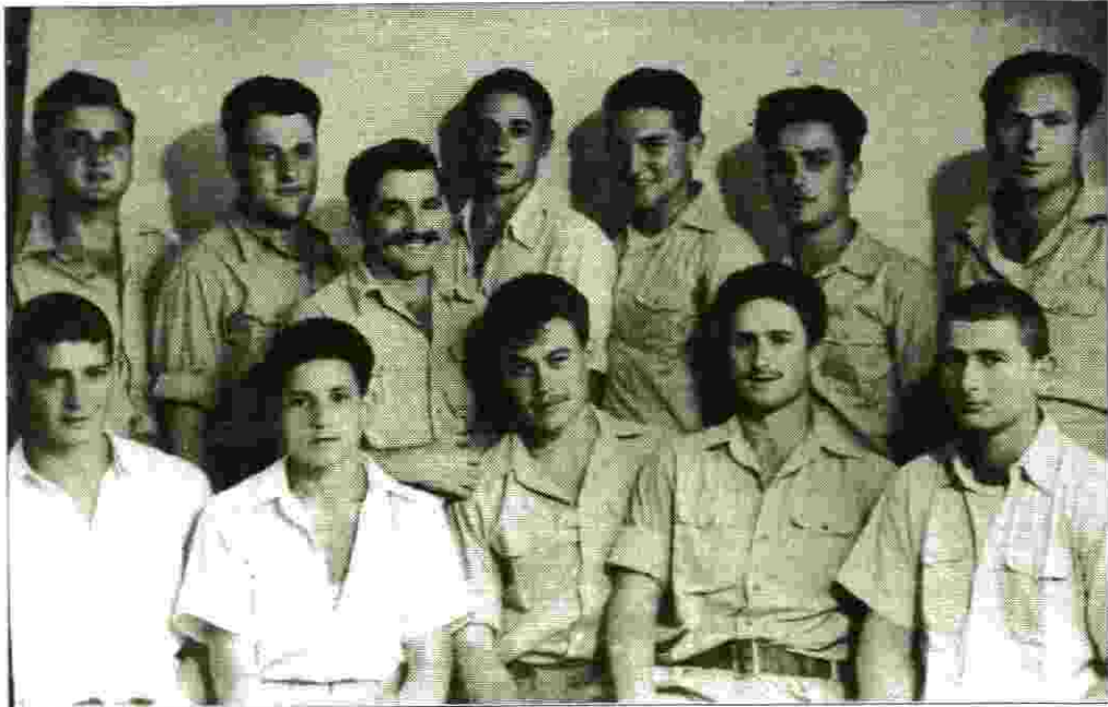
"ה-12 מלטרון" -

מזרח ראיתי את משטרת לטרון והרי ירושלים, ועד היום לא ביקרתי שם מעולם. מסביב למחנה הייתה גדר כפולה, ונשמרה ע"י מגדלי שמירה עם זרקורים, לא ארחיב את הדיבור, כי היו שם דברים רבים אשר אפשר לכתוב עליהם. אחר חצי שנה שוחררנו והחבורה שלנו התפזרה. אני חזרתי