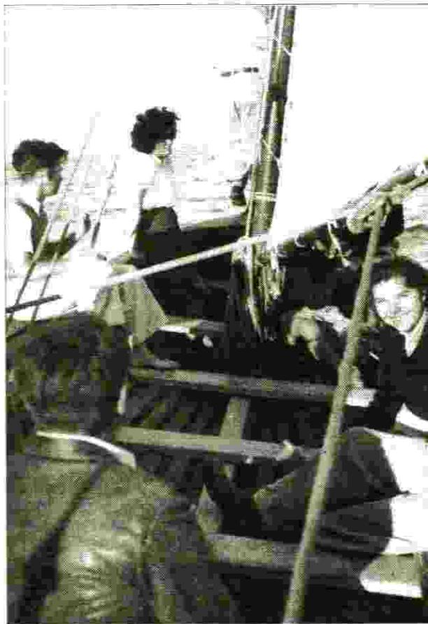
חברי ההכשרה המגויסת בהפלגת כף

השתחרתי לרורבה עם כל ההכשרה באוגוסט 1947. הגרעין אליו השתייכתי התמקם בקרית-חיים והרבה חברים נשלחו לכבוש העבודה בנמל חיפה (בסוף מלחמת העצמאות הקימו את נחשולים-טנטורה). אני נשלחתי לשנת שירות בתנועת "הנוער העובד" ושימשתי כמרכז הסניפים בעמק יזרעאל. לאחר התגברות ההתקפות על התחבורה והישובים בעמק, גויסתי במרץ 1948 לגדוד הראשון תפקיד קצין תרבות עד שנפצעתי בקרב במלכיה ביום 16 במאי 1948. לאחר החלמתי, "נזכרו" בי בחיל הים, נשלחתי למטה החיל למחלקה הקשר ואף עברתי את קורס הקצינים הראשון בחיל הים. בשנת 1949 עזבתי את חיל הים ואת חיל הקשר ועברתי לחיל החימוש בו מילאתי תפקידים של מפקד סגדאות וקצין חמוש חטיבתי עד לשחרורי מהמילואים בשנת 1984.