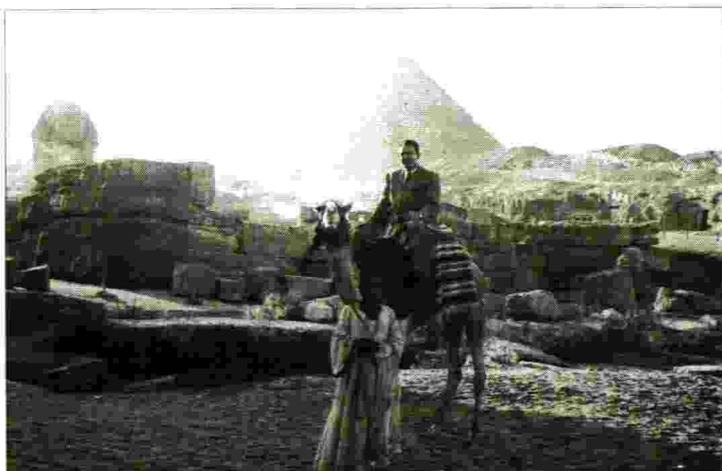
ובהמשך - הפעילות גם במצרים

לאור המצב בארץ ביקשתי להשתחרר מתפקידי בש"י ועל כן יועדתי להפליג כגדעוני באנייה טירת צבי. ההפלגה עברה ללא אירועים יוצאי דופן, ולכשנגרנו לחיפה, נכנסתי לסליק באנייה ולמחרת בהעברת העולים לקפריסין יצאנו מהסליק ובעזרת אנשי סולל בונה יצאנו את הנמל לחוף - לגיוס לצה"ל, ללוות הקמת חיל הים בהתהוות, לצאת לקורס קציני קשר של צה"ל ולאחר ההסמכה - לחיל הים לתפקיד קצין קשר ועד לראשות קצין הקשר.