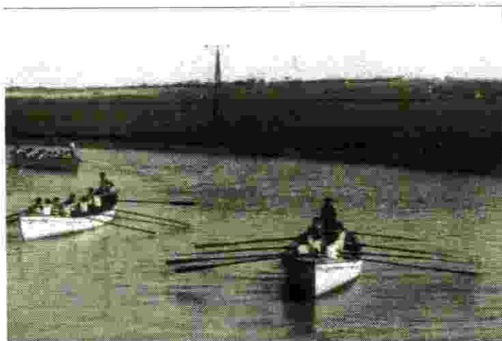
נסיון ימי על הירקון

כל יתר האידועים והמעשים שקרו בתקופת ההעפלה בשנים 1945-1948 הלא הם כתובים בדוחות ובדברי הימים של ההעפלה.