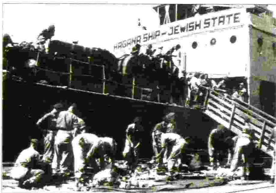
לאחר ההעלאה בכוח לאוניות הגירוש, מחטטים המגרשים ברכושם הדל של המעפילים

בראשית 1949 חזרתי "סופית" ארצה, השלמתי את הליכי הגיוס הרשמי לצה"ל והוצבתי בחיל הקשר עד לשחרורי