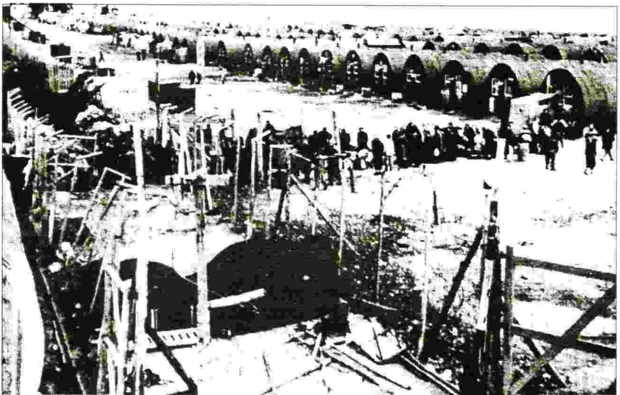
מחנה "דיקיליה" בקפריסין - התור לשחרור ע"פ המכסה החודשית

תמה משימה זו. הוטל עלי לחזור לארץ בתפקיד מלווה ימי עם אוניית המעפילים "חיים ארלוזורוב" הלא היא הספינה "אולואה" שאת סיפוריה המרתקים אספר בסיפור אחר.