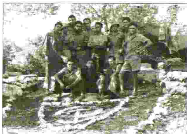
חברי הקורס הימי של ה"הגנה" שלא הפליגו עם ה-כ"ג למשימתם - ממנה לא חזרו.

תדרכו אותנו זמן קצר לפני הפעולה בגלל סודיות המבצע. כדי שלא נדע עליו זמן רב מראש. ההפלגה בוצעה על הספינה של משטרת החופים המנדטורית "ארי-הים", ששלטונות הצבא החרימו אותה מהמשטרה האנגלית בחיפה, עד היום קיים בליבי ספק באם לא הם - בעלי הספינה, הטמינו בה חומר נפץ עם שעון מכוון לפיצוץ כדי להכשיל כל פעולה שתעשה עם ספינה זו ובמיוחד כאשר יהודים יפעילו אותה, כי היחסים בין אנגלים ויהודים באותה תקופה היו מתוחים ביותר.