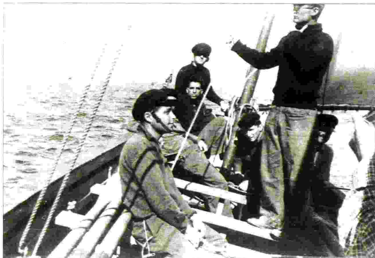
אימוני הקורס הימי האחרון של ה"הגנה" - 1941. מקורס זה הורכב צוות ה-כ"ג למשימתו. העומד ליד התורן - בתריאל יפה ז"ך

תדרכו אותנו זמן קצר לפני הפעולה בגלל סודיות המבצע. כדי שלא נדע עליו זמן רב מראש. ההפלגה בוצעה על הספינה של משטרת החופים המנדטורית "ארי-הים", ששלטונות הצבא החרימו אותה מהמשטרה האנגלית בחיפה, עד היום קיים בליבי ספק באם לא הם - בעלי הספינה, הטמינו בה חומר נפץ עם שעון מכוון לפיצוץ כדי להכשיל כל פעולה שתעשה עם ספינה זו ובמיוחד כאשר יהודים יפעילו אותה, כי היחסים בין אנגלים ויהודים באותה תקופה היו מתוחים ביותר.