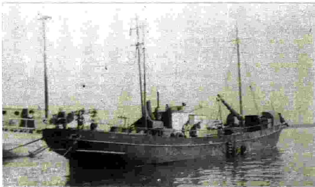
הספינה "ברל כנלסון" הורידה את המעפילים בחוף שפיים, נתפסה בתום הפעולה

משנוכחו שיש להם עניין עם אנשי ההעפלה התרככו ולבסוף, כעבור כשלושה שבועות, סוכם כי ישחררו אותנו בשני תנאים: האחד, שנפענח את המברקים שהיו ברשותם ונתרגמם עבורם והשני, שנטפל רק בנושאי ההעפלה ולא נפגע, בשום דרך, בממשלה הצרפתית עצמה.