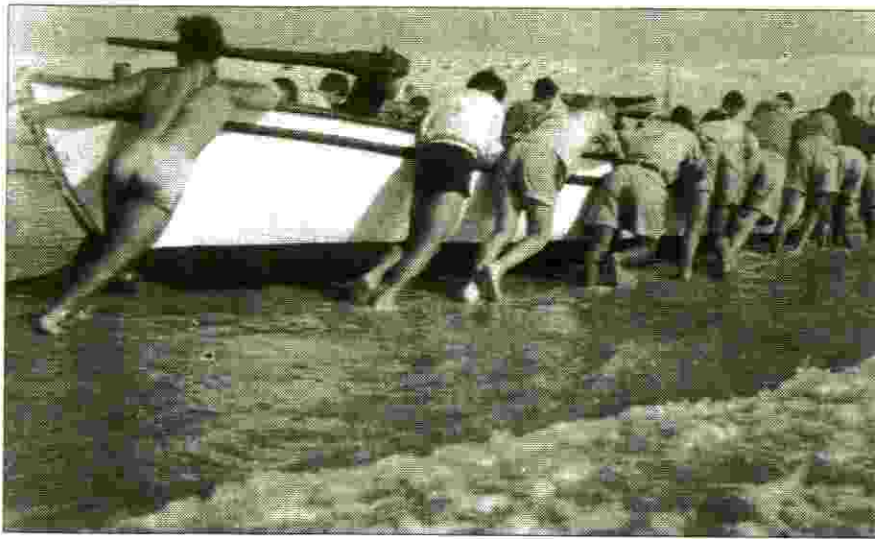
את הסירות להוציא מן המים ... (קורס 6)

מ-1982 ועד 1985 ניהלתי את המועצה לשיווק פרי הדר. מ-1985 ועד 1992 כיהנתי כמנכ"ל בנק ישראל. מתפקידי זה פרשתי לגמלאות. מאז אני מכהן כדירקטור בחברות שונות, ומתנדב בעמותת "הילד החוסה".