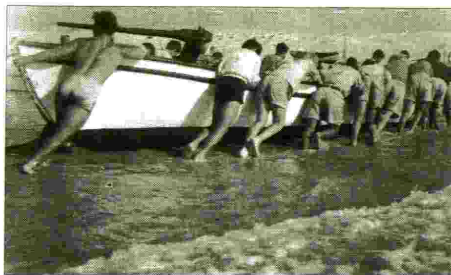
את הסירות להוציא מן המים ... (קורס 6)

מ-1982 ועד 1985 ניהלתי את המועצה לשיווק פרי הדר. מ-1985 ועד 1992 כיהנתי כמנכ"ל בנק ישראל. מתפקידי זה פרשתי לגמלאות. מאז אני מכהן כדירקטור בחברות שונות, ומתנדב בעמותת "הילד החוסה".