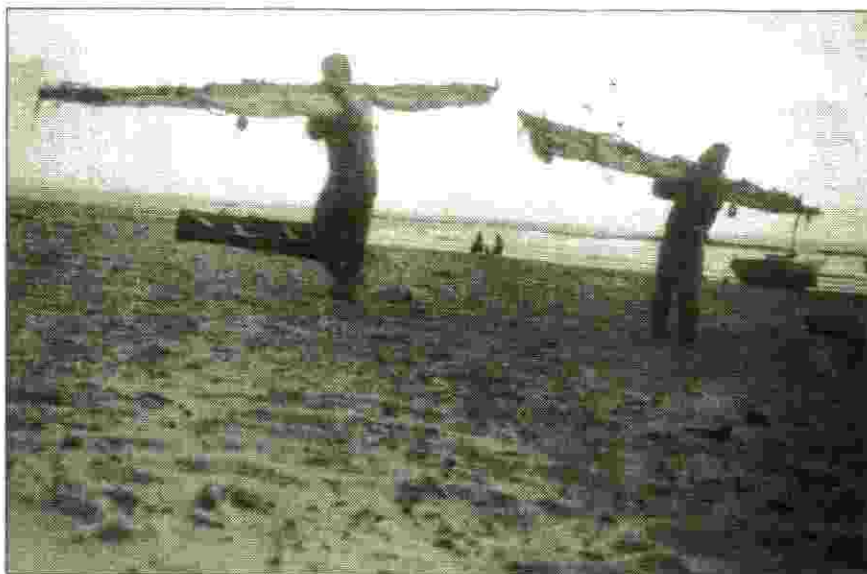
בקורס מפקדי סירות