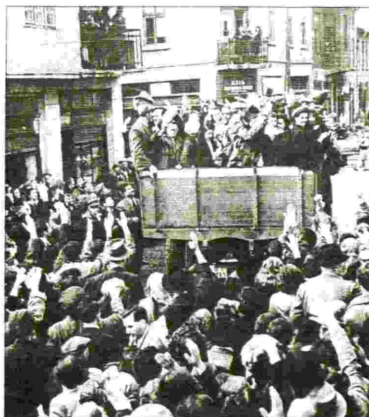
בדרכי "הבריחה" לחופי הדרום לעליה ל"ארץ ישראל"