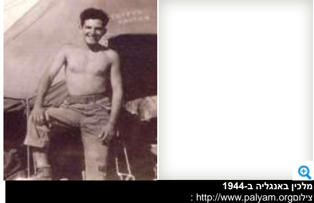
מלכין באנגליה ב-1944