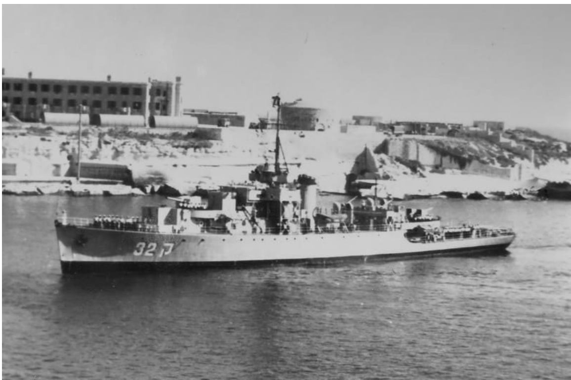
אח"י 'מזנק' ק-32