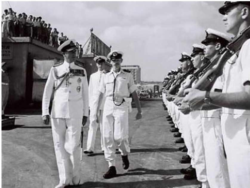
לורד מאונטבטן מבקר בישראל, תל-אביב יולי 1952