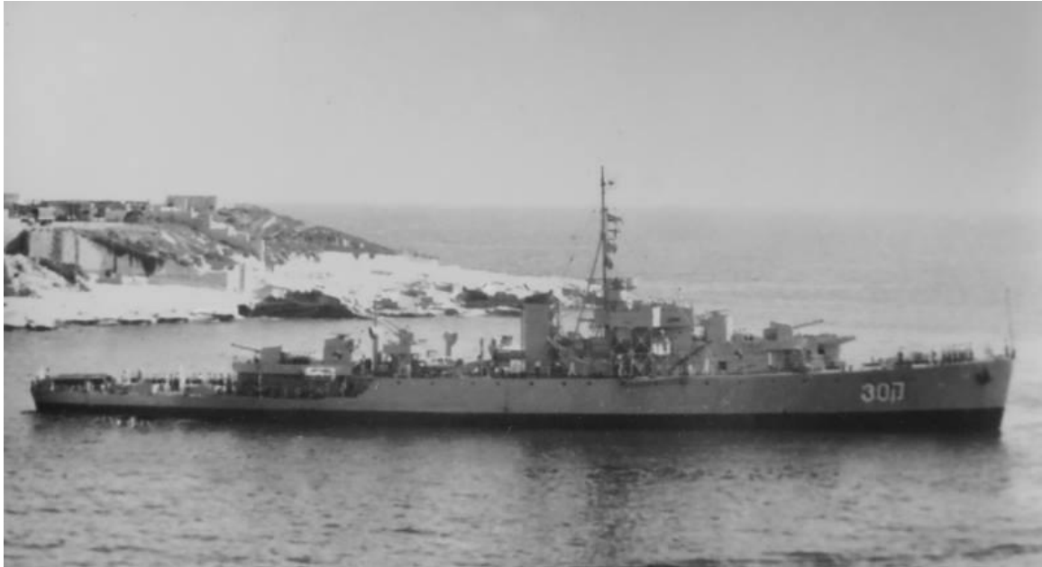
אח"י 'משגב' ק-30