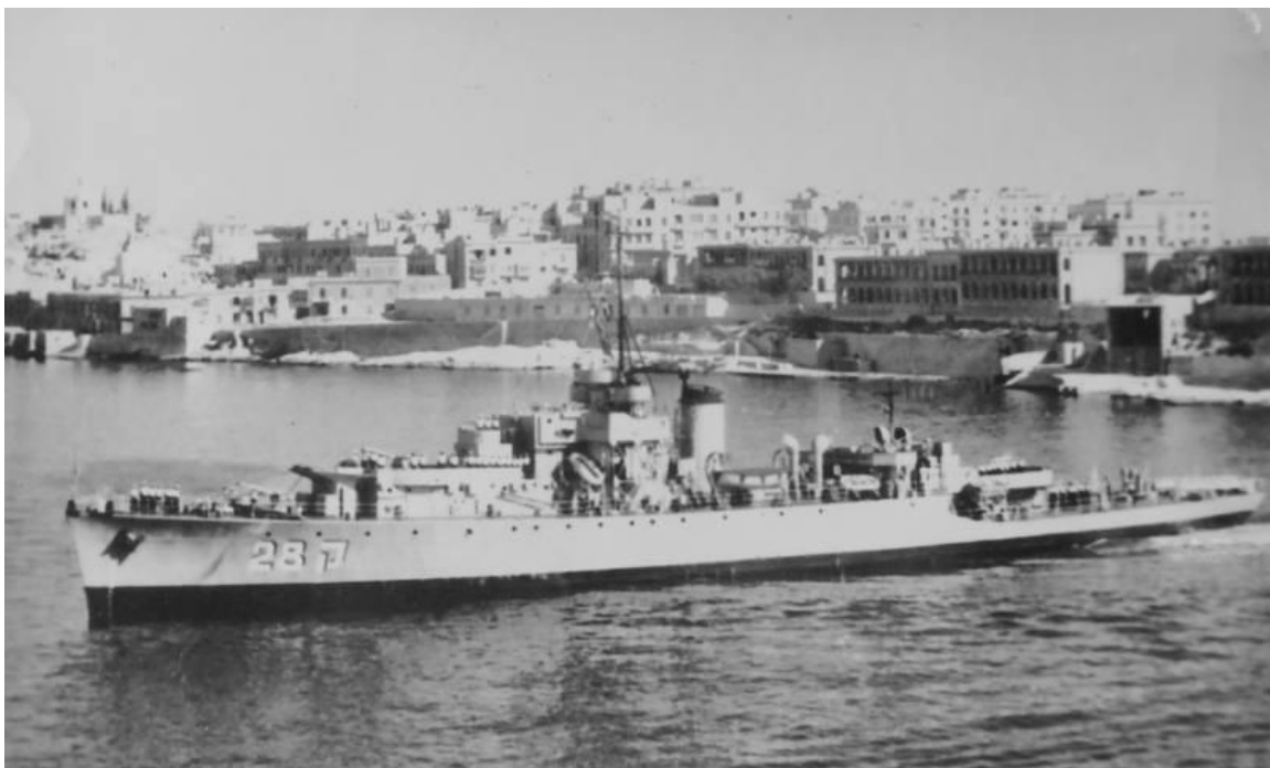
אח"י 'מבטח' ק-28

תמונות של הפריגטות בעת ביקורן במלטה: