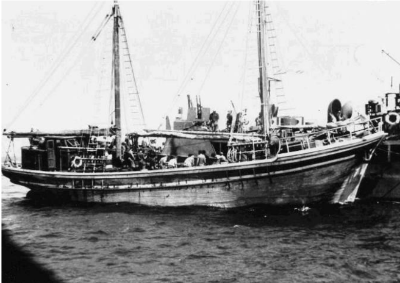
'ארג'ירו' בצד קורבטת חיל הים, לאחר ההשתלטות עליה בלב-ים