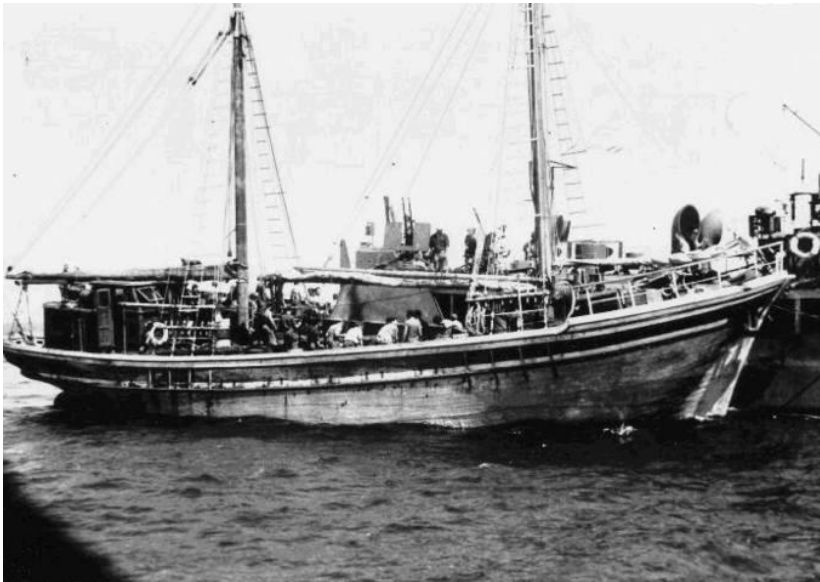
'ארג'ירו' בצד קורבטת חיל הים, לאחר ההשתלטות עליה בלב-ים