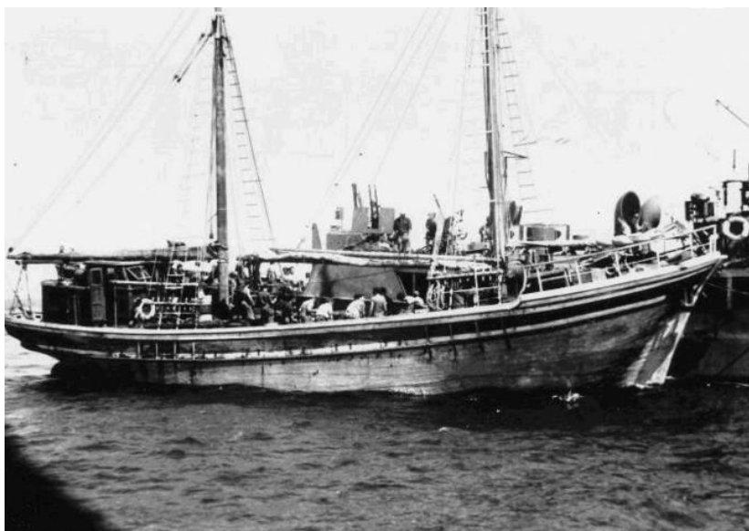
'ארג'ירו' בצד קורבטת חיל הים, לאחר ההשתלטות עליה בלב-ים