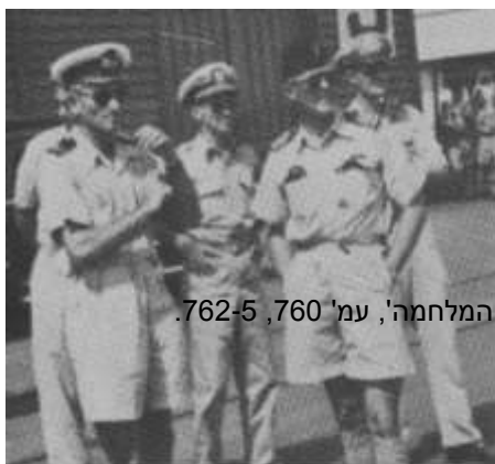
זאב הים משמאל - "המפקח" על... משקיפי או"מ.

1.8.48 - לזאב הים באיטליה לא ניתנה עזרה למרות כל הדרישות של שאול".