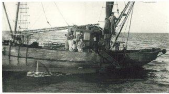
ההכשרה המגויסת של הפלי"ם בתעסוקה ואימונים על ספינת הדייג " נאמן " של קיבוץ " שדות ים "