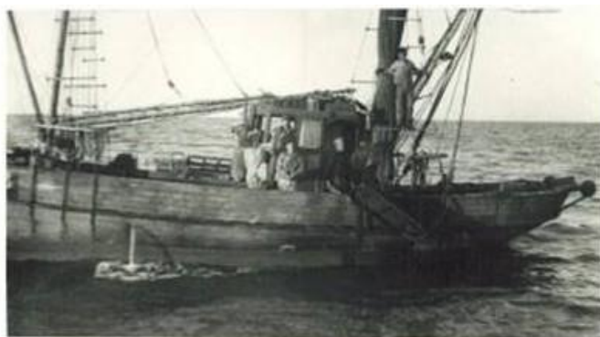
ההכשרה המגויסת של הפלי"ם בתעסוקה ואימונים על ספינת הדייג "נאמן" של קיבוץ "שדות ים"