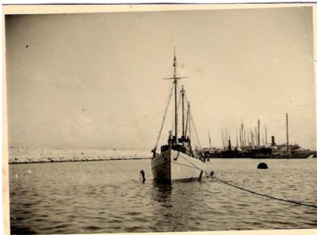
'הכריש' – "סוס העבודה" של "המיוחדת"

הכיסוי הספינה לא נוצלה להברחת נשק. ואילו בארץ, משקיפי האו"ם ששרצו בנמל חיפה, נעקפו והצעירים הורדו במזח הדייג בנחל הקישון והוסעו מיד באוטובוס לבקו"מ של צה"ל.