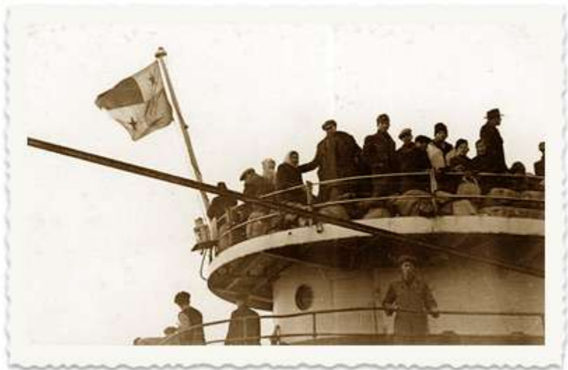
אניית המעפילים "עצמאות". ב-1 בינואר 1948 הגיעה לחופי קפריסין