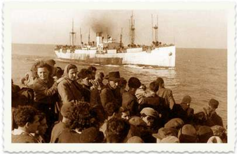
ה"פאנים" יצאו עם המעפילים ב-24 בדצמבר 1947 מנמל בורגס. לאן הגיעו תחילה?