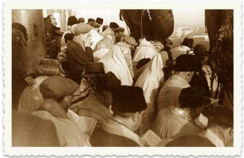
על סיפון העצמאות. תפילת המעפילים