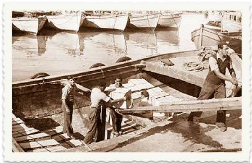
חברי ההגנה מתגייסים במרץ למשימה. ביום הם בונים נמל ובערבים ובשבתות מכשירים את האנשים למשימות ים