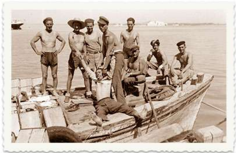
שלטון המנדט מתיר לנציגי הישוב העברי להקים את נמל תל-אביב. .