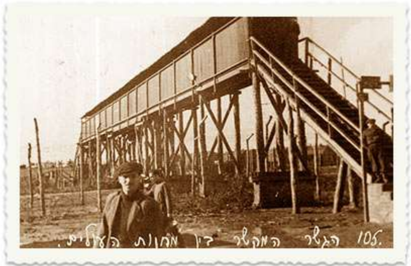
הגשר שחיבר בין מחנות המעצר בקפריסין. מי מזהה?