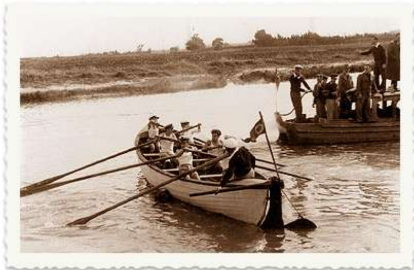
1935 אנשי ההגנה, ראשוני ארגון עליה ב' מתאמנים בנושאי ימאות בשפך הירקון במסווה של מועדון שייט.

בכתבה זו נביא תצלומים מאלבומו של ברצ'יק, המתעדים את פועלו בהבאת יהודים לארץ ישראל.