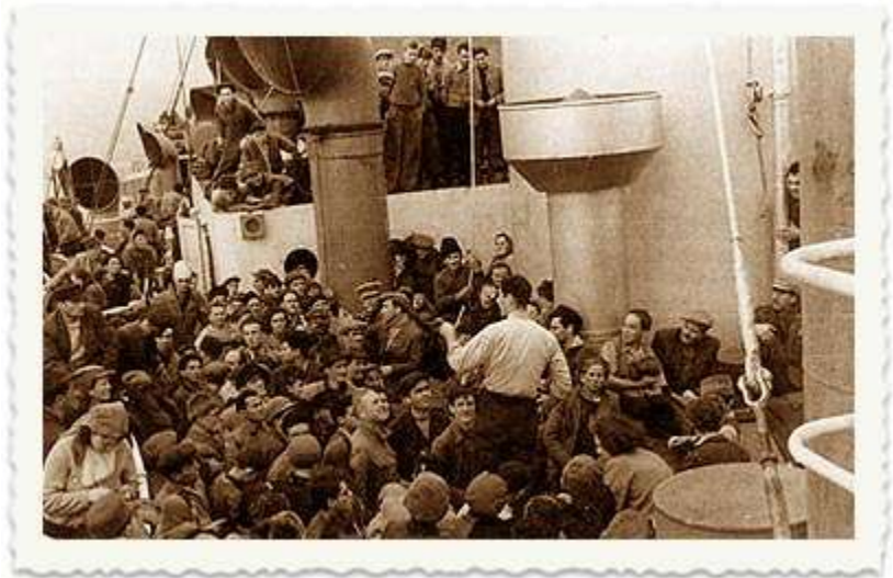
נדחקים על הסיפון