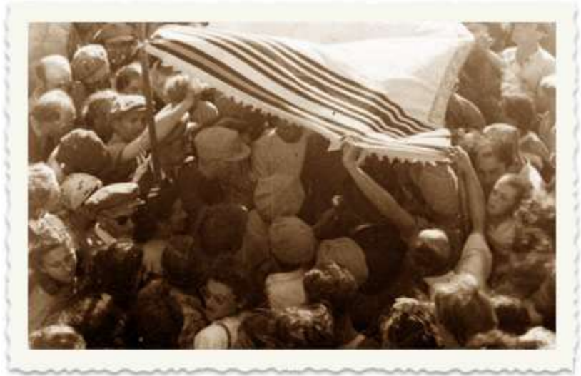
חתונה במחנה המעצר בקפריסין