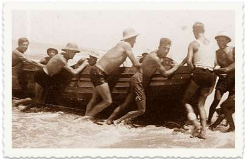
בהמשך עוברים חברי החוג הימי לקיבוץ שדות ים, שם לצד העיסוק בדייג הם מתאמנים בחוף קיסריה.