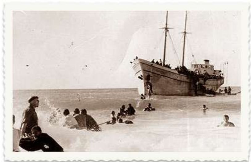
[הערת מערכת האתר: התמונה היא של 'האומות המאוחדות' בעת הורדת המעפילים בחוף נהריה, 1 ינואר 1948]

ברצ'יק נשלח עם אנשי פלי"ם נוספים להביא מעפילים לא". בפסח 1946 הביאו אנשי עליה ב' 1014 מעפילים מרחבי אירופה לעיר הנמל לה-ספציה באיטליה בכוונה להעלותם על אוניית מעפילים לא". האיטלקים עזרו בדר"כ לאנשי העפלה אלא שבמקרה הגיע באותו זמן לידיעת המשטרה האיטלקית ידיעות על נאצים המנסים להימלט מאירופה דרך לה-ספציה. הם חשדו במעפילים ומנעו את עלייתם לאוניה. בעקבות האירוע פרצו המעפילים בשביתה.