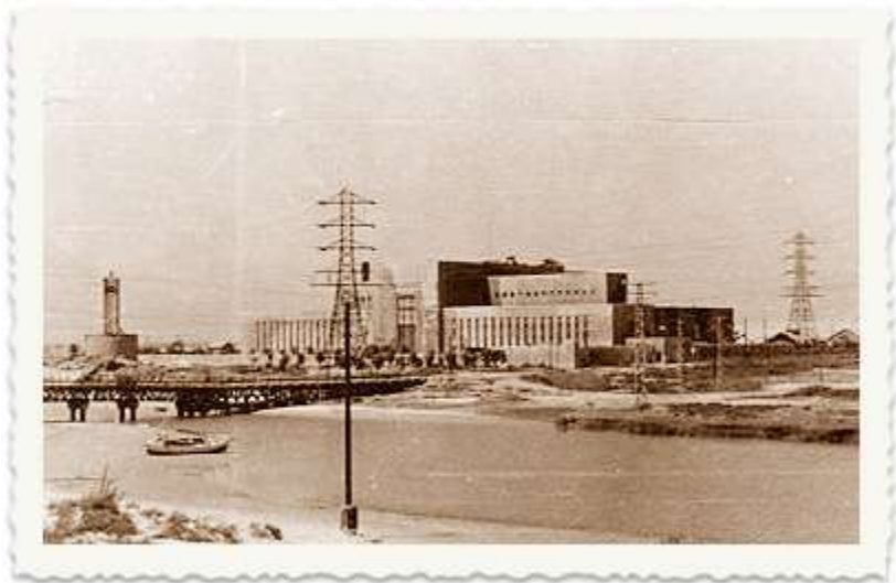
בשנת 1936 פורץ המרד הערבי בארץ ישראל. הערבים משביתים את נמל יפו.