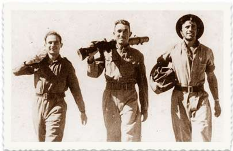
בשנת 1941 התקיים שיתוף פעולה בין ההגנה לצבא הבריטי כנגד אפשרות של פלישת גרמניה למזרח התיכון. הוקם הפלמ"ח ובתוכו פלוגות הים. ברצ'יק (מימין) הופך למדריך ומכשיר את חברת כ"ג יורדי הסירה.