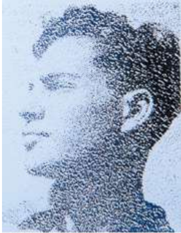
דוד ליווינגסטון. דיווח על בניעת רימון

ככל שנוקף הזמן, הם יודעים, הזיכרון מתעמעם והעדים מתמעטים. לפני שיהיה מאוחר מדי, החליטו לצאת למאבק פומבי נגד צה"ל ומשרד הביטחון.