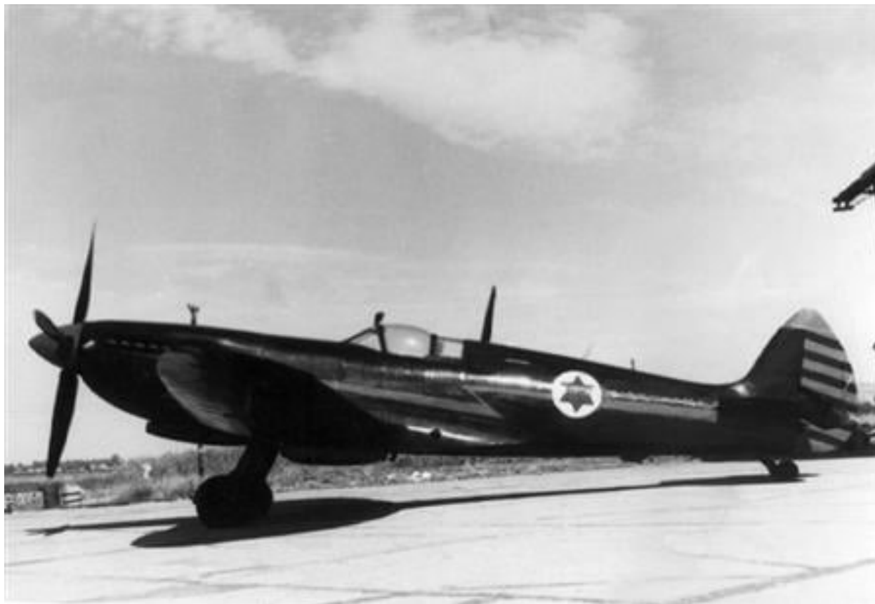
"יורק" (ספיטפייר) בשרות חה"א

גם את הדור השני של מטוסי הקרב של חה"א רכשה ישראל בצ'כוסלובקיה – 50 מטוסים מהדגם הבריטי הידוע 'ספיטפייר' שהבריטים נתנו לצ'כים מתנה אחרי מלה"ע, בזכות פעילותו בזמן המלחמה של חיל האוויר הצ'כי החופשי במסגרת ה-RAF (חיל האוויר הבריטי). למטוסי הספיטפייר הודבק הכינוי "יורקים". מסוף ספטמבר 1948 ועד סוף 1948, במסגרת שני מבצעים שכוננו 'ולוטה-1' ו'ולוטה-2', הגיעו לארץ 14 הראשונים שבהם בטיסה בכוחות עצמם (עם חניית ביניים לתדלוק ביוגוסלביה). 5 מהמטוסים לא הגיעו ליעדם – 3 התרסקו בדרכם ו-2 נחתו נחיתה אונס ברודוס והוחרמו ע"י שלטונות יוון (בחודשי פברואר ומרץ הגיעו דרך נמל שיבניק שביוגוסלביה יתר 31 ה"יורקים", באמצעות אוניות הנשק של מערכת הרכש).