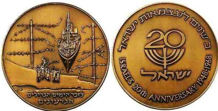
40 שנה ל'אקסודוס '47 הנפקה: 1987