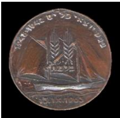
כנס פלי"ם הראשון הנפקה: 1963