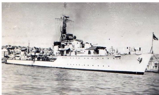
H M S Chequers