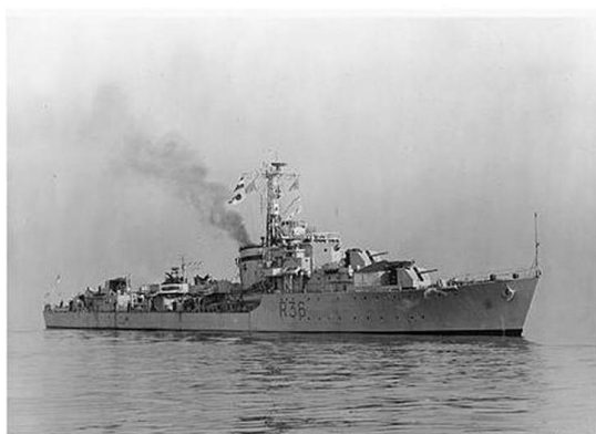
HMS Chieftain - R36

פרשת 'אקסודוס' מוזכרת בכתבה, אך ללא אזכור הניסיון האומלל לשינוי במדיניות והחזרת המעפילים לארץ המוצא (שהסתיימה כידוע בהחזרתם, מכל המקומות, לגרמניה, למרות הכוונה הראשונית להחזירם לצרפת). החלטת 'כ"ט בנובמבר' 1947 שיחררה את הצי המלכותי מאחת המועקות הגדולות ביותר בתולדותיו, שכן בעיקבותיה חדלו המלוויים מאירגון המעפילים להתנגדות אלימה להשתלטות הבריטים על ספינות המעפילים. חודש לאחר ההחלטה, ליוותה – בהסכמה – שייטת בריטית את שתי "הפאנים" הישר לקפריסין. הצי המשיך בסגר עד לתום המנדט ב-15 למאי 1948 – ספינת המעפילים "נחשון", נתפשה ב-26 לאפריל, אך המלוויים נצטוו שלא להתנגד להגליית המעפילים לקפריסין ו"אונית הרכש", Borea-2, נעצרה ב-13 למאי ושחררה למחרת היום בחצות, בתום המנדט, מבלי שהנשק, שהיה מכוסה במטען של קופסאות מיץ עגבניות, התגלה.