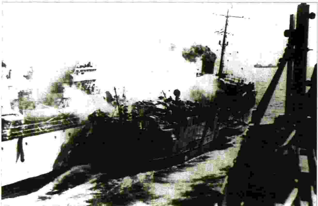
האוניה "חיים ארלוזורוב" כמאבק נגד המשחתות הבריטיות

כמוסקבה. עבדתי מטעם מדינת ישראל באיראן ובניקרגואה, וכן בקורדיסטן ובמרוקו. כמשך 14 שנים הייתי חבר-כנסת ושרתתי כמזכ"ל מפלגת העבודה. השתתפתי בפגישות ראשונות עם מנהיגים פלשתינאים. כמשך עשרים השנים האחרונות אני עובד כמורה. לימדתי בעיריית פיתוח בגליל ובנגב והחל מ-1986 אני מקים את כפר הנוער ניצנה בגבול ישראל-מצרים.