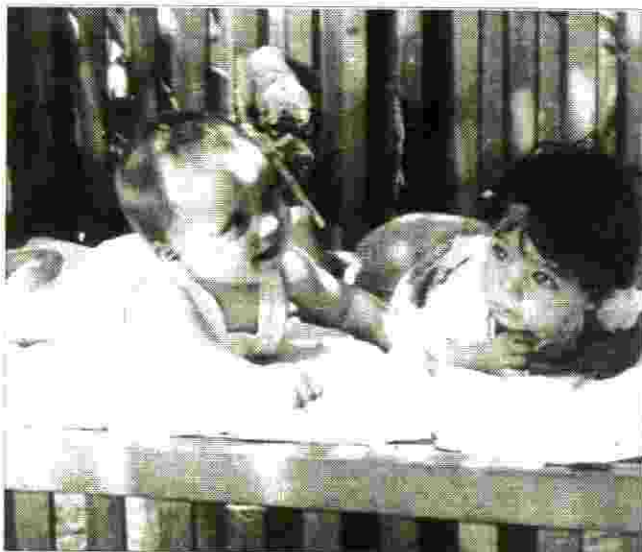
2200 נולדו כמשך 30 חודשי קיומם של "מחנות הגידוש" בקפריסין

אני מקיים את מצוות האמרה הספרדית: "Con Jamon y Vino se anda camino" עם סטיקים ויין, נמשיך בדרך, בינתיים".