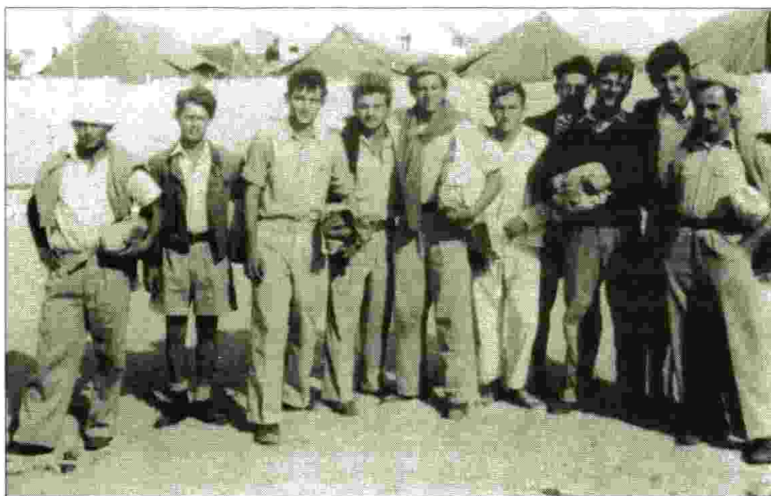
קורס מפקדי סירות 5, לקראת היציאה לפוצץ את משטרת החוף ב"סידני-עלי" כתגובה על תפישת האונייה "ברל כצנלסון" - נובמבר 1945

1960-1962: קצין טכני בכיר לנושא צוללות ובהמשך מרכז ואחראי לשיפוץ של הצוללת "תנין" במספנת חיל