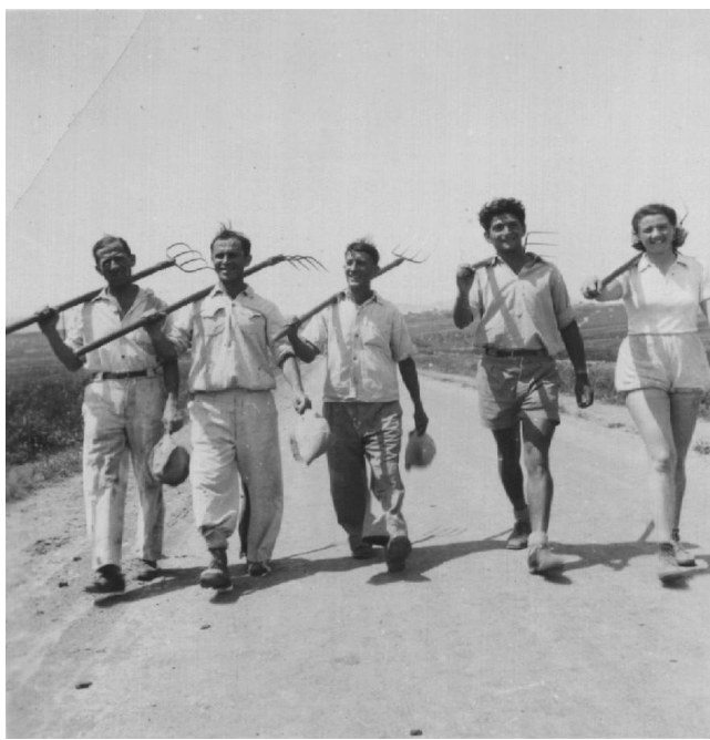
צילום: סמק שני מימין, בשדה

לפני עלותי ארצה היו באות חברות של אמא להזהיר אותה בפני הצעד הנמהר של שליחת ילד לארץ שוממה ולקונן על גורלו המר: "מה הוא יאכל שם? הרי אין שם תפוחי עץ. אפילו תפוחי אדמה אין שם". זכרתי זאת כשחרשתי במחרשה החדשה ששפעה תפוחי אדמה. הייתי גאה מאוד וכתבתי על כך לאמא.